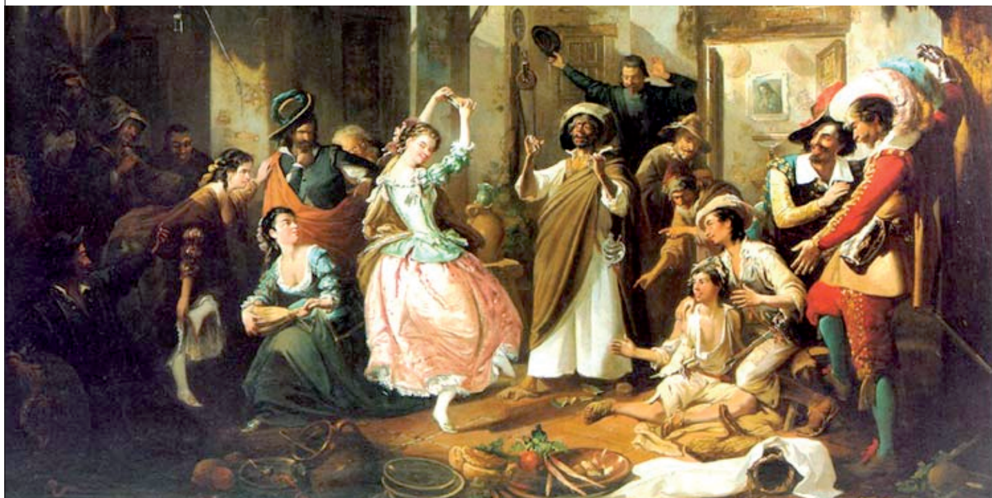
Rinconete y Cortadillo , Manuel Rodríguez de Guzmán (siglo XIX).